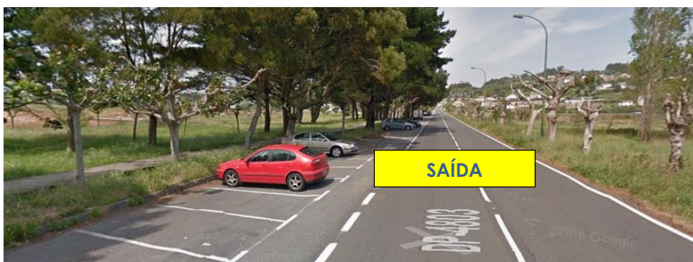
Imaxe 10. Saída da proba