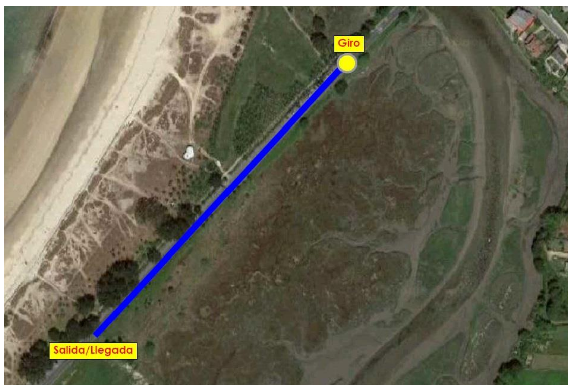
Imaxe 4. Percorrido Benxamins