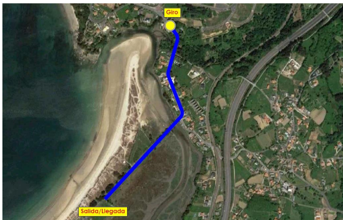
Imaxe 6. Percorrido Infantis