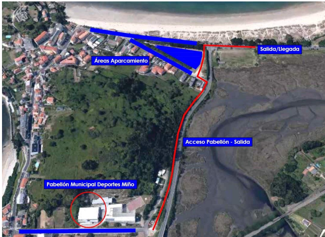
Imaxe 2. Áreas Disponibles

O circuïto discorre por asfalto e o acceso a el estará completamente pechado a todos os vehículos, agás os autorizados pola organización.