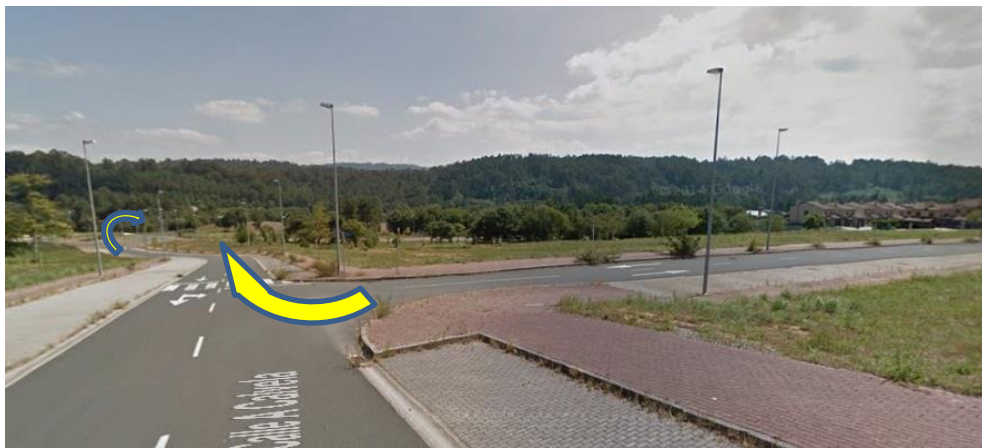
Imaxe 14. Xiros Costa Miño (km 6,500)