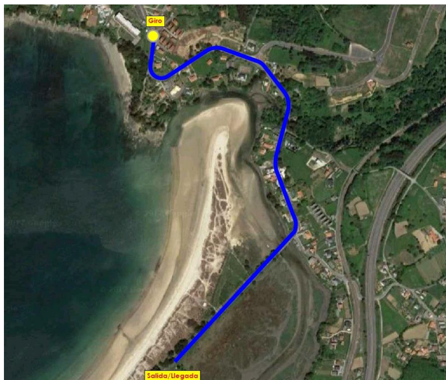
Imaxe 7. Percorrido Cadetes e Xuvenis