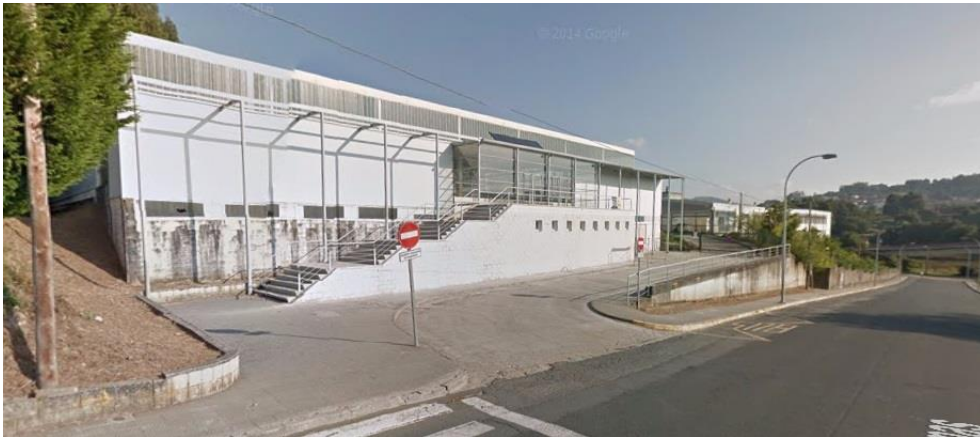
Imaxe 17. Pavillón Municipal de Deportes de Miño

Ao final das carreiras, os corredores dispoñerán de duchas e vestiarios no Pavillón Municipal do Deporte do municipio de Miño ( en función do avance da pandemia ).