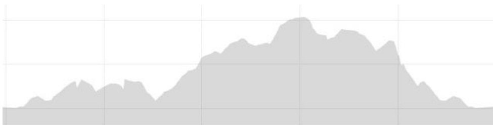
Imaxe 9. Perfil da carreira