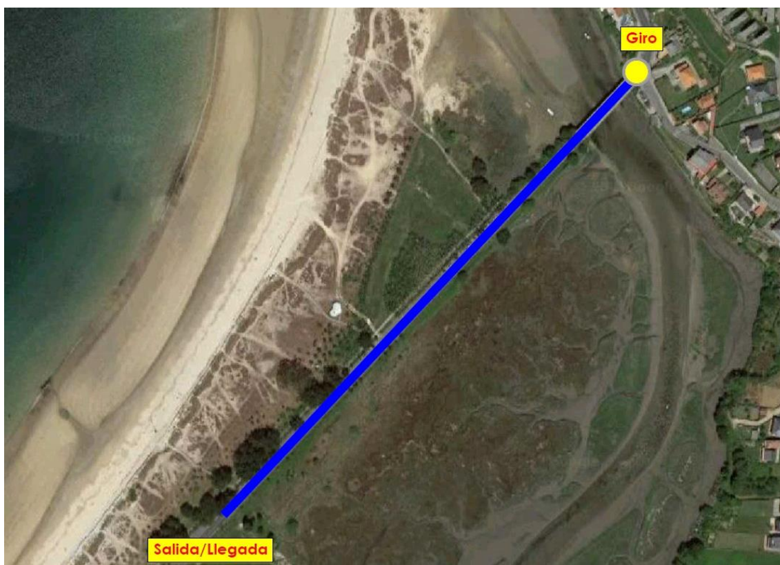
Imaxe 5. Percorrido Alevins