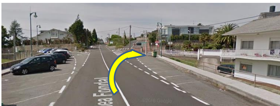
Imaxe 11. Cruce Praia Perbes (km 3)