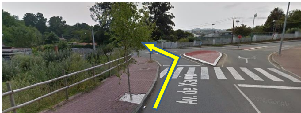
Imaxe 15. Saída Costa Miño (km 9)