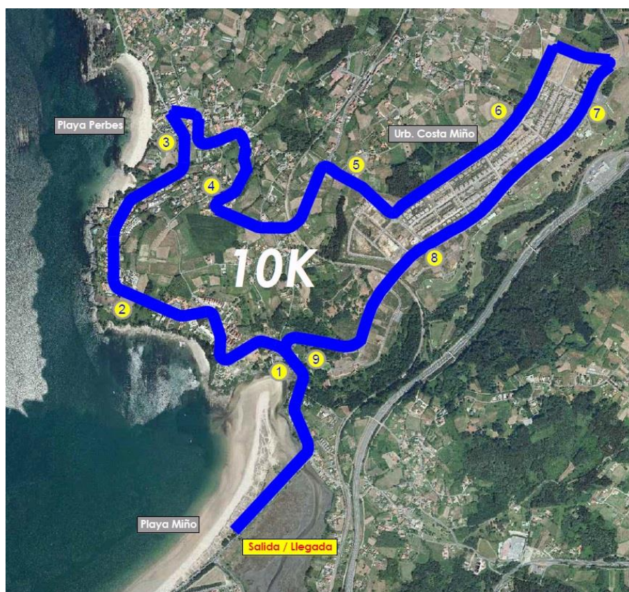
Imaxe 8. Percorrido e fitos quilométricos