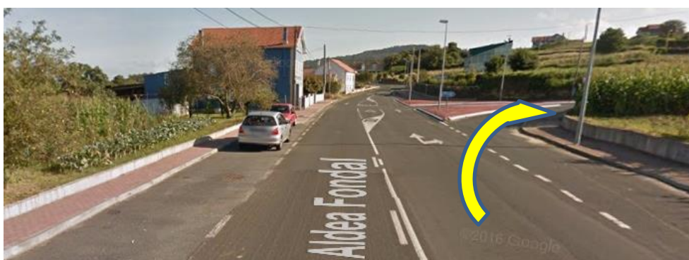
Imaxe 12. Cruce Entrada Costa Miño (km 4,800)