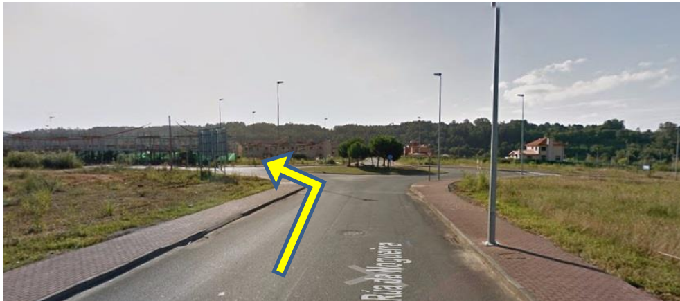
Imaxe 13. Cruce Costa Miño (km 5,400)