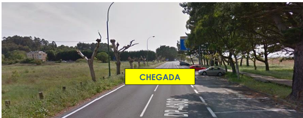
Imaxe 16. Chegada Praia Miño (km 10)